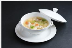
豆腐と白きくらげのスープ