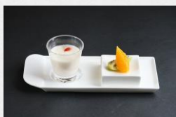
デザートプレート