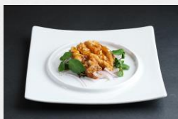
サラダ仕立ての油淋鶏