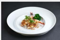
天然海老と春雨のガーリック蒸し